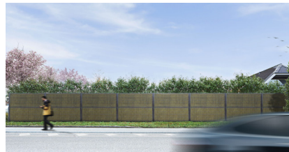
Anthrazit RAL 7016