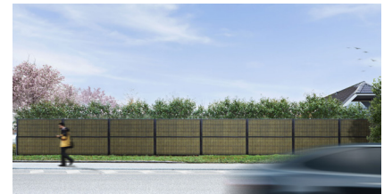
Schwarz RAL 9005